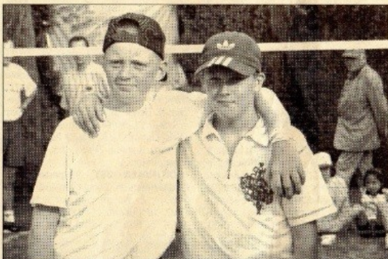
Les finalistes juniors

«L'originalité, l'amitié et le respect d'autrui doivent rester les seuls carburants de l'animation qui nous rassemble», a précisé