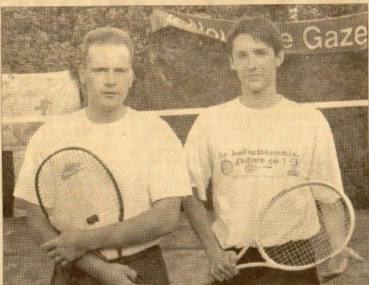
Les finalistes messieurs