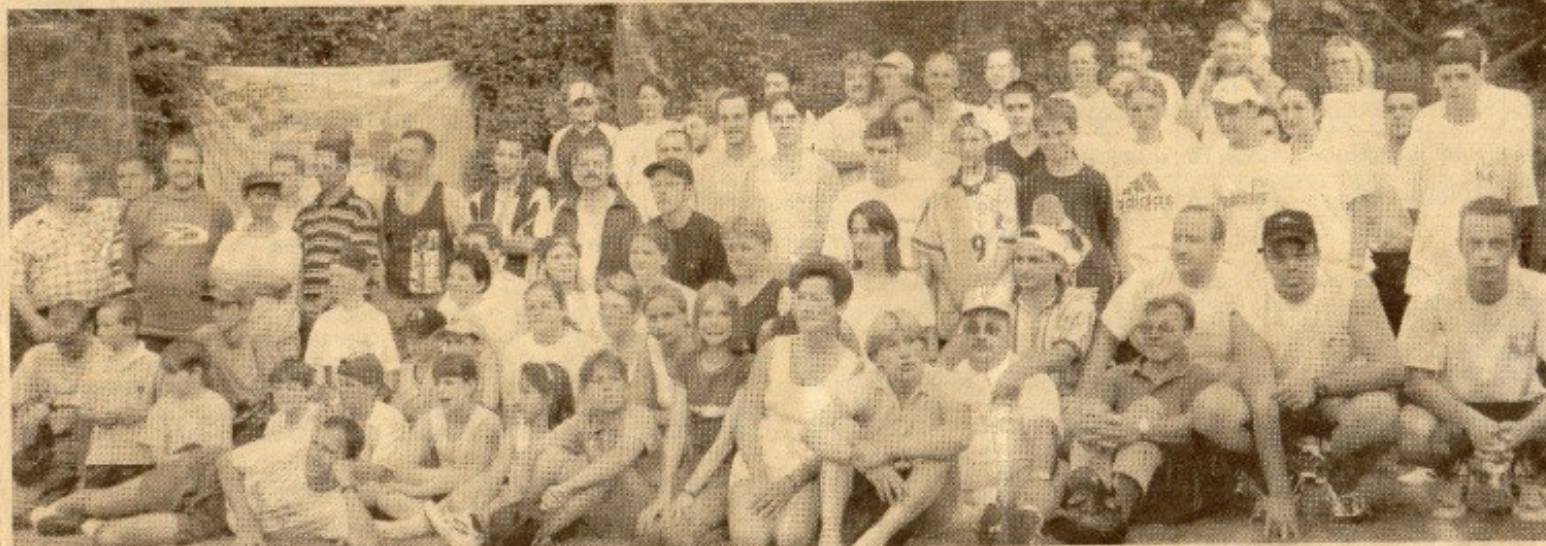
Les participants au tournoi