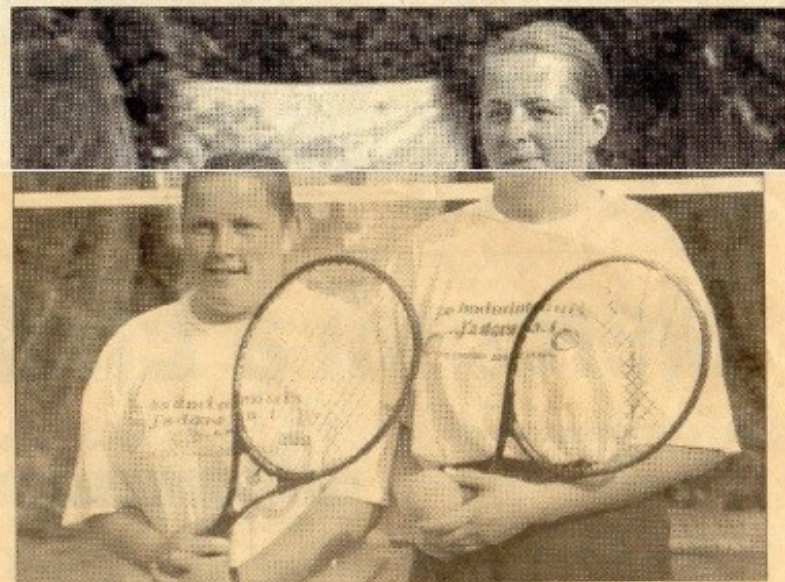
Les dames finalistes