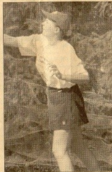
Un joli sport...